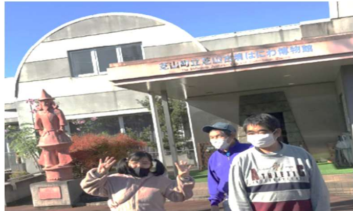
柴山町立はにわ博物館

今回も、帰り道には 「♥ また来たい♥」 「今度いつ遊びに来れる？」 と 皆さん、楽しい一日だったと 喜んで下さいました