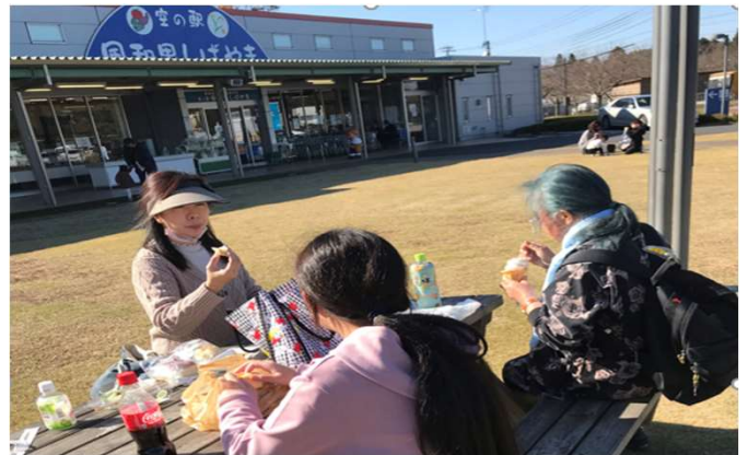
空の駅ふわりにてソフトクリーム

公園では、皆さん、大はしゃぎ！！ やはりブランコは大人気で 順番に乗り、こぎあったり とっても楽しそう！！